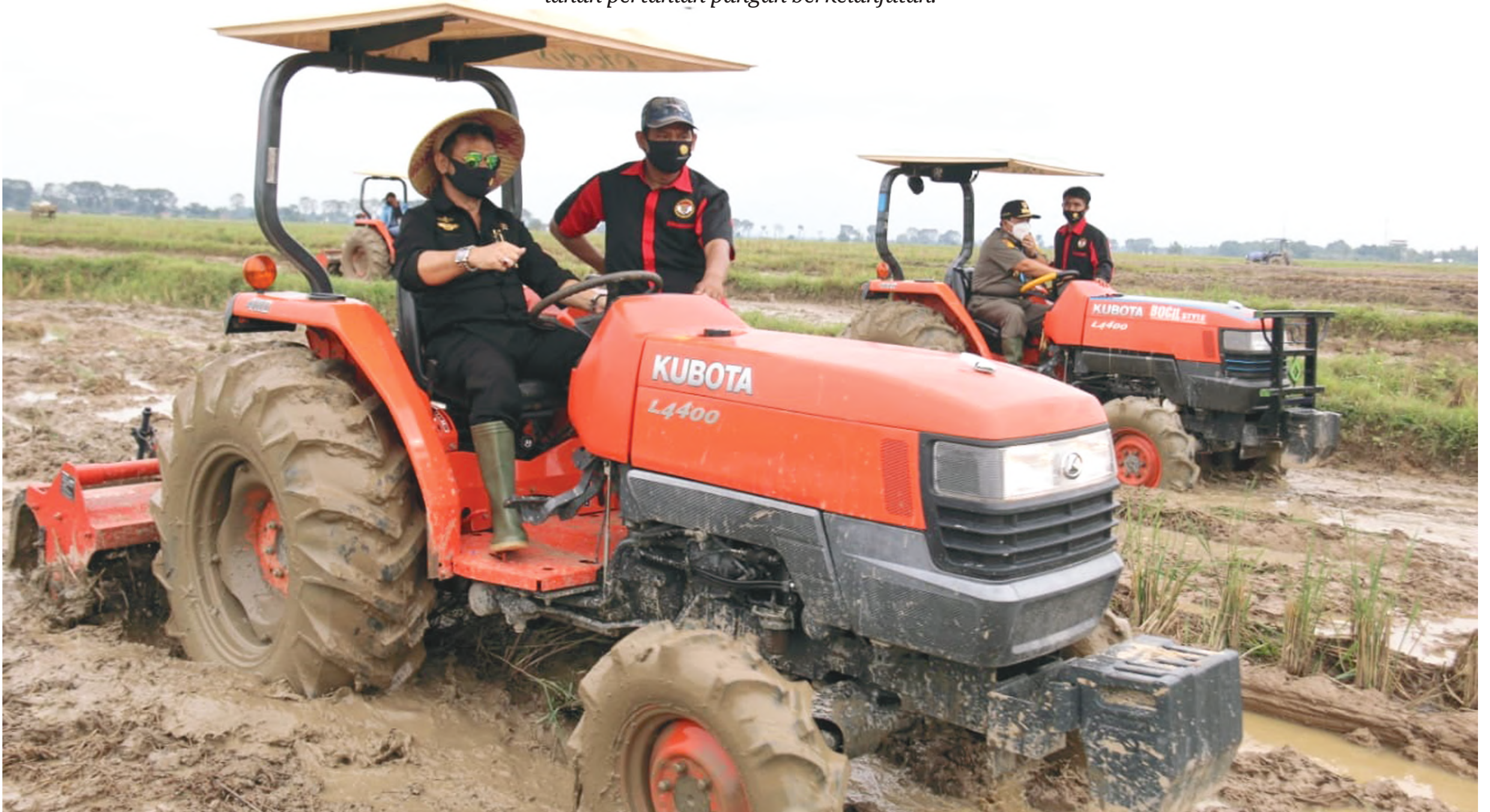
PASTIKAN KETERSEDIAAN PANGAN: Menteri Pertanian Syahrul Yasin Limpo bersama Gubernur Lampung Arinal Djunaidi mencoba traktor saat melakukan kunjungan kerja ke Lampung untuk memastikan ketersediaan pangan di Lampung aman beberapa waktu yang lalu.

Seluruh pihak membangun komitmen bersama dalam pengendalian alih fungsi lahan melalui perlindungan lahan pertanian pangan berkelanjutan.