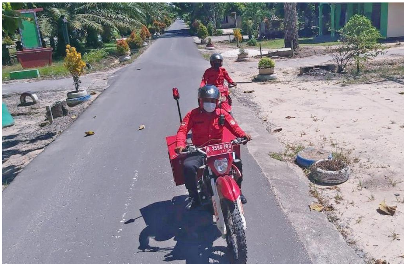
KELILING DESA: Anggota Manggala Agni berkeliling desa menyampaikan imbauan bahaya karhutla.

Saat ini telah terjadi pergeseran dari pengelolaan hutan yang difokuskan, terutama pada pengelolaan kayu, menuju pengelolaan ekosistem lanskap hutan yang lebih luas. Reorientasi strategis ini diharapkan dapat mengelola hutan secara bijak dengan memperhatikan nilai-nilai adat dan keanekaragaman hayati. (H-2)