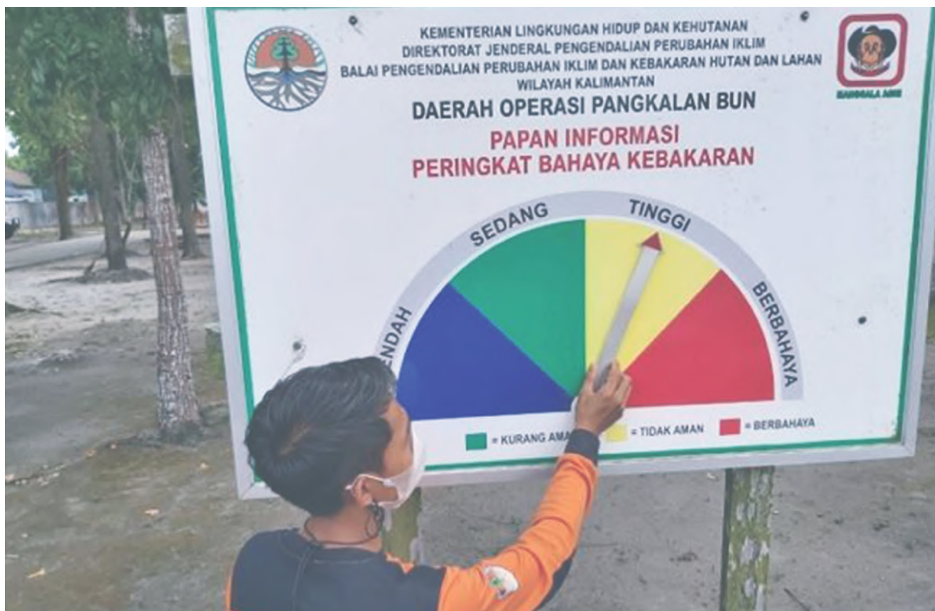
PAPAN INFORMASI: Pengaturan papan informasi bahaya karhutla.