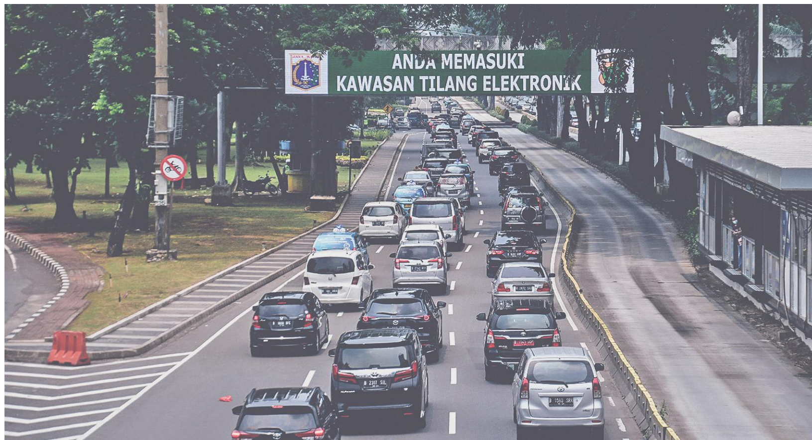
KAWASAN TILANG ELEKTRONIK: Kendaraan melintas di bawah papan digital bertuliskan 'Anda Memasuki Kawasan Tilang Elektronik' di Jalan Jenderal Sudirman, Jakarta, kemarin. Direktorat Lalu Lintas Polda Metro Jaya telah menyiapkan 30 kamera electronic traffic law enforcement (ETLE) mobile untuk menindak pelanggaran lalu lintas. Rencananya, kamera ETLE mobile itu akan diluncurkan pada Sabtu (20/3).