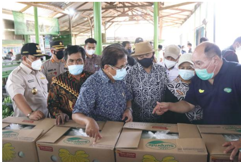
PISANG EKSPOR: Menteri Agraria Tata Ruang/Badan Pertanahan Nasional (ATR/BPN) Sofyan A Djalil, Menteri Koperasi dan Usaha Kecil Menengah (UKM) Teten Masduki, dan Gubernur Lampung Arinal Djunaidi melihat sentra pisang mas yang komoditasnya telah berhasil pada pasar ekspor, serta hasil kerajinan usaha mikro, kecil, dan menengah (UMKM) yang ada di Kecamatan Sumberejo Tanggamus, beberapa waktu yang lalu.