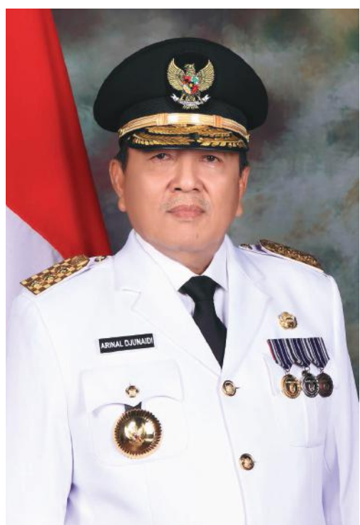
Arinal Djunaidi Gubernur Lampung