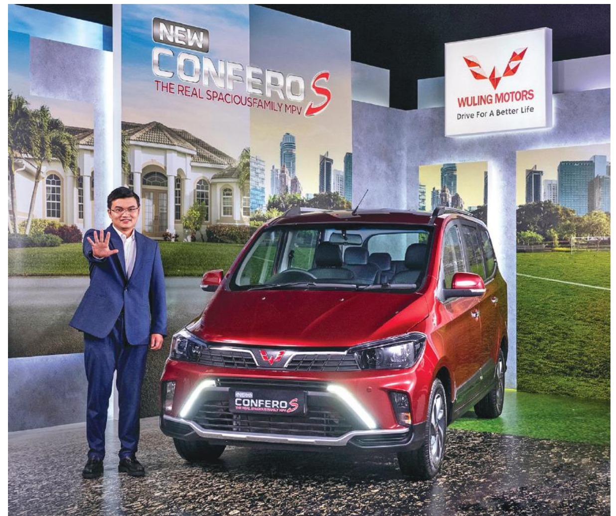
NEW CONFERO S: Assitant of President Wuling Motors Han Dehong di acara peluncuran Wuling New Confero S secara virtual di Jakarta.

MPV keluarga ini juga dibekali fitur keselamatan dan keamanan yang lengkap di kelasnya, seperti front & rear parking sensor, rear parking camera, Tire Pressure Monitoring System (TPMS), emergency stop signal (ESS), sensor dual SRS airbag, front and rear parking, sistem pengereman ABS & EBD, seatbelt in-