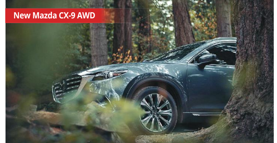
New Mazda CX-9 AWD