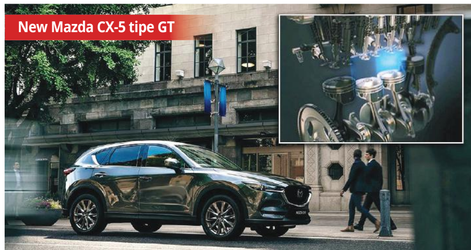
New Mazda CX-5 tipe GT

Kendaraan ini ditawarkan dalam lima pilihan warna, terdiri atas Carnelian Red, Pristine White, Dazzling Silver, Aurora Silver, dan Starry Black. "Kami berharap New Confero S ini bisa menghadirkan incredible space for new excitement bagi keluarga Indonesia dalam setiap perjalanan," tutup Han Dehong. (S-2)