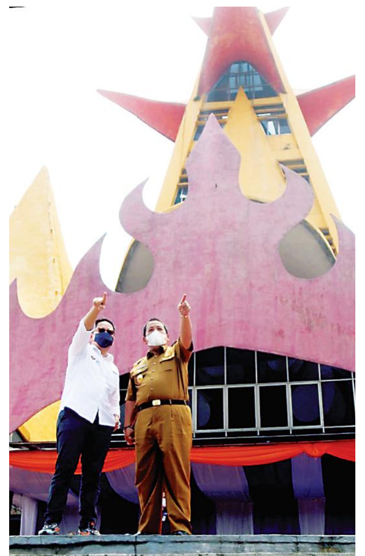
PERCEPATAN PEMBANGUNAN PARIWISATA LAMPUNG. Gubernur Lampung Arinal Djunaidi (kanan) bersama Wakil Menteri BUMN II Kartika Wirjoatmodjo di Menara Siger saat kunjungan ke Bakauheni, Lampung Selatan, Selasa (16/3). Gubernur Lampung Arinal Djunaidi meminta semua pihak bersinergi mewujudkan percepatan pembangunan pariwisata terpadu Bakauheni Harbour City agar rampung pada 2022.