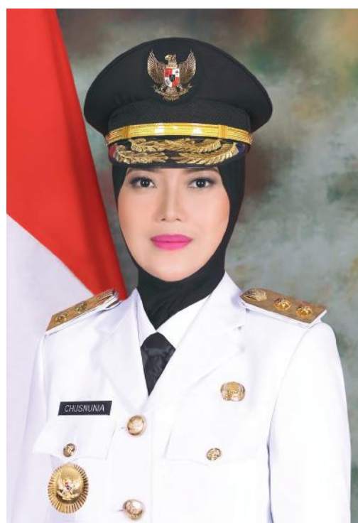
Chusnuniah Chalim Wakil Gubernur Lampung