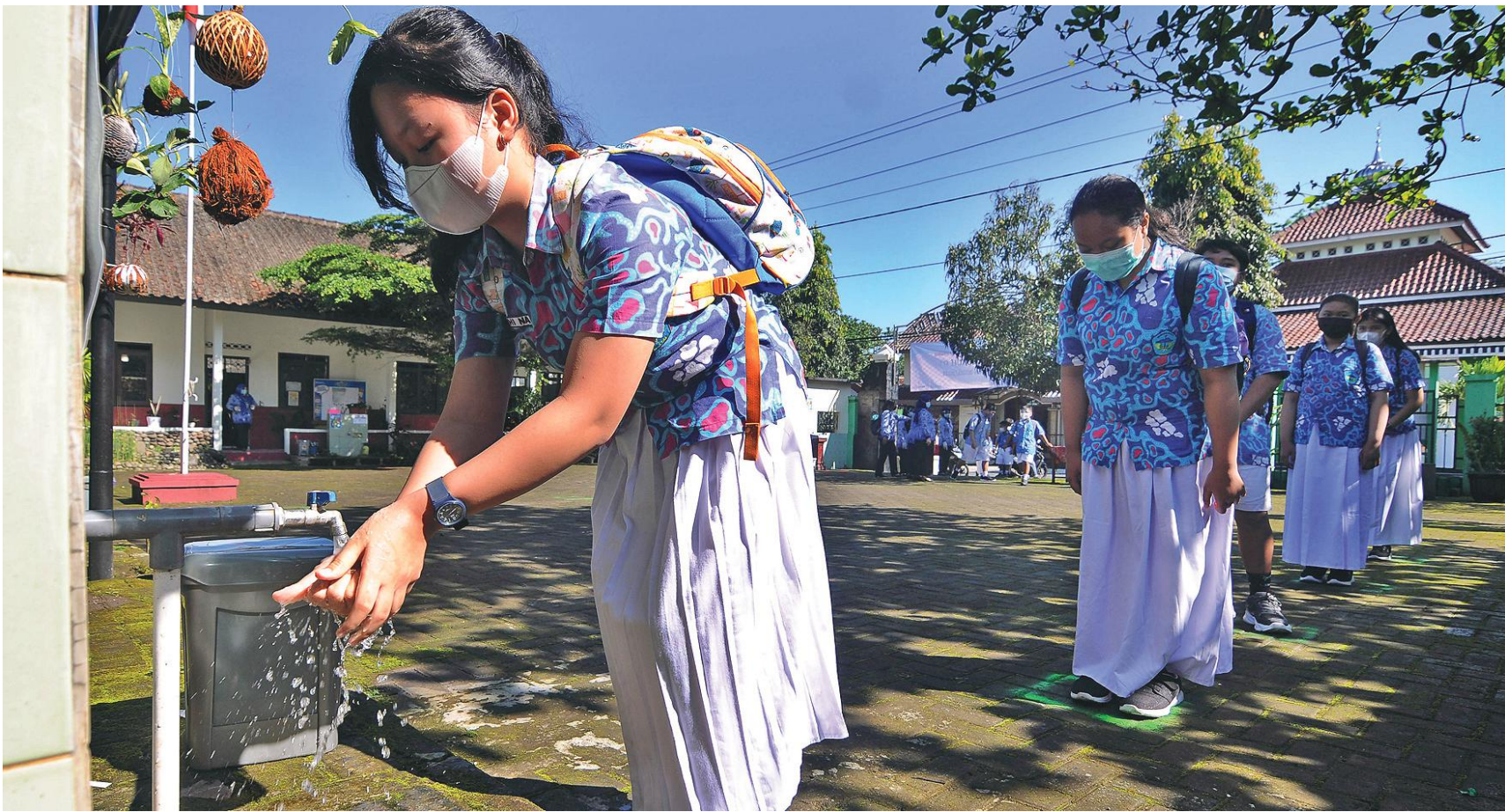
PROTOKOL KESEHATAN DI SEKOLAH: Para siswa antri mencuci tangan sebelum masuk ruang kelas di SD Negeri Dukuh 1, Salatiga, Jawa Tengah, kemarin. Penerapan protokol kesehatan covid-19 di sekolah tersebut bertujuan menyosialisasikan kebiasaan baru lebih sehat di lingkungan sekolah.