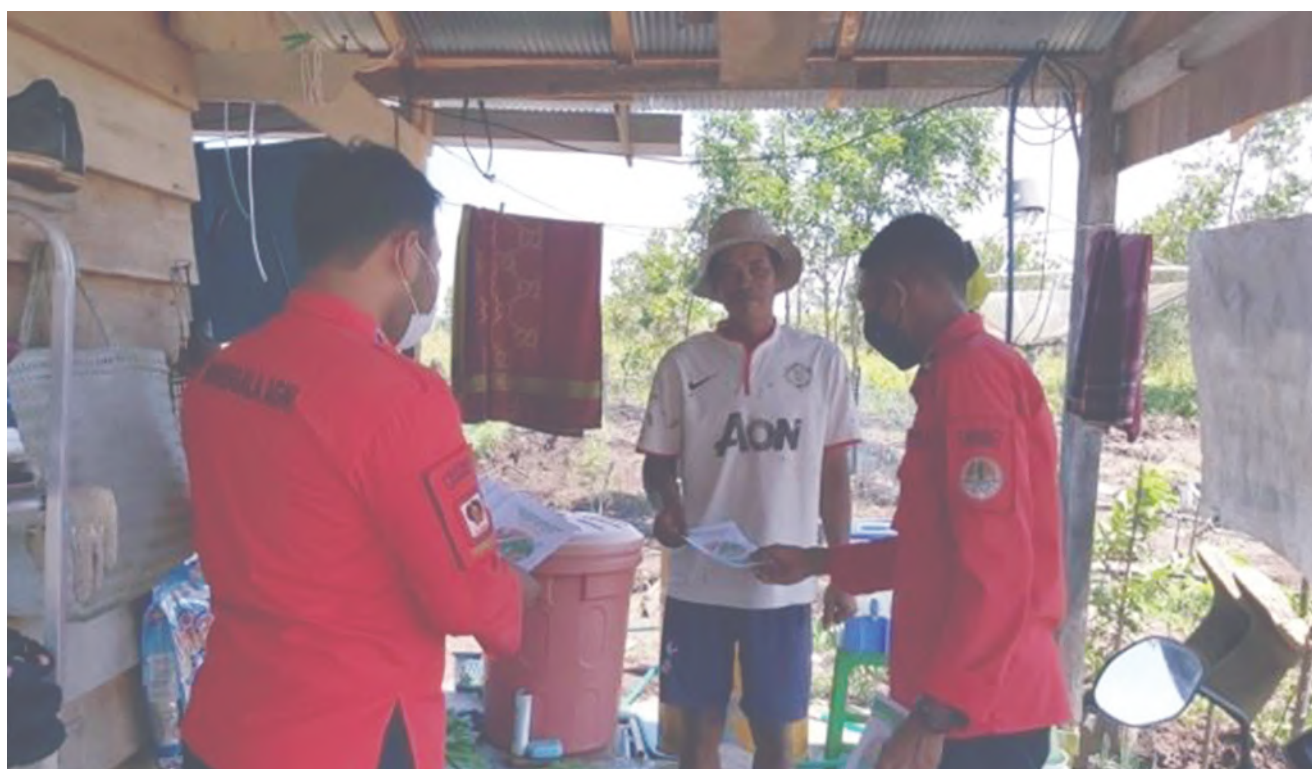
BAGIKAN PAMFLET: Sosialisasi secara langsung kepada masyarakat dengan membagikan pamflet/leaflet di desa.